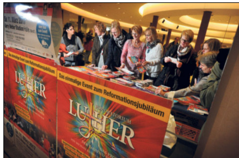
Informationsmaterial und Fanartikel zum Pop-Oratorium konnten die Mitwirkenden schon bei der Probe erstehen.